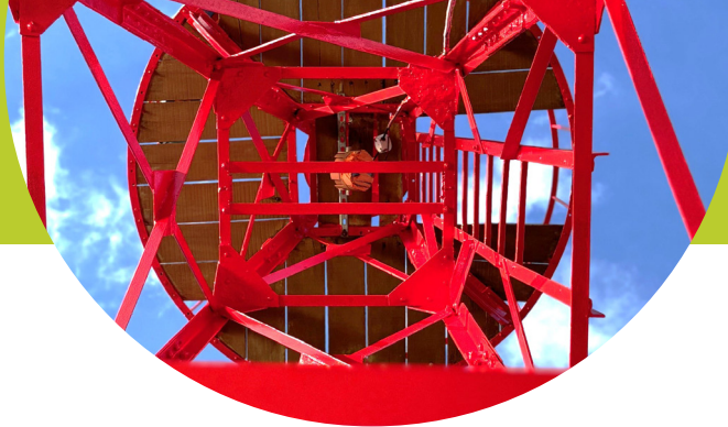
1 ère Pierre de la Java