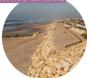
LA PROTECTION DU LITTORAL