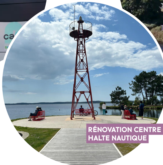
RÉNOVATION CENTRE BOURG-HALTE NAUTIQUE