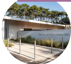
LA CRÈCHE DE L'OcéAN