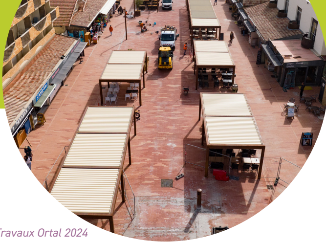
Travaux Ortal 2024

→ Rénové les trottoirs et voiries : rue Mimosas / Massenet/ Grands pins/ Monfeuga / Clémenceau/ du Huga/ Danton/ Lapouyade/ Beausite/ Marie-Curie. Avenue des Landes/ allée des Golfs / chemin de Mistre / voie du Baganais / route du Lion.