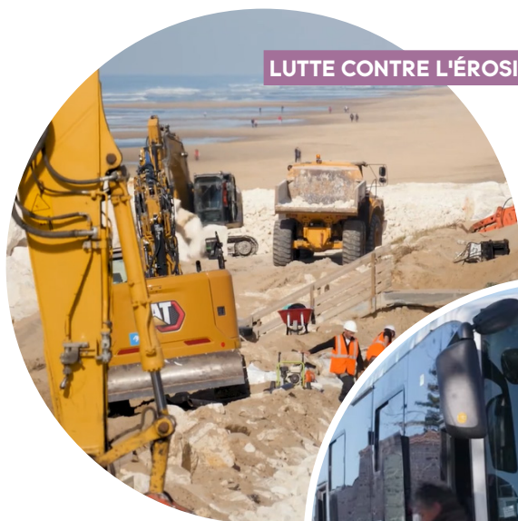
LUTTE CONTRE L'ÉROSION