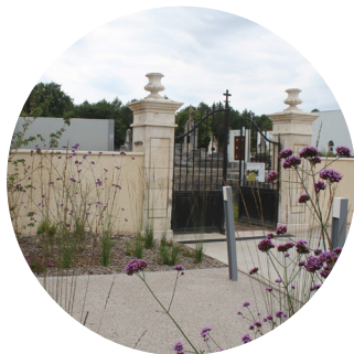
Nouveau portail du cimetière

→ Réaménagé des parkings Hôtel de Ville et Stade Albert François et créé 2 parkings au co-working et Av. Albert François.