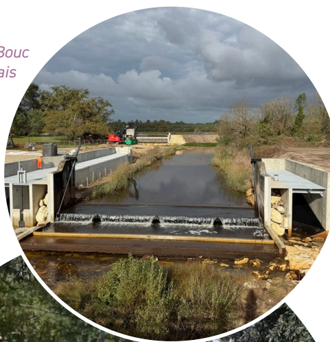
Ouvrage du Pas du Bouc renaissance du marais de l'Ilette

→ Mis en place une politique "Zéro déchet" avec: tri et achats responsables et fin du plastique à usage unique dans la commande publique.