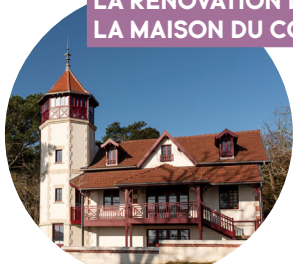
LA RÉNOVATION DE LA MAISON DU COMMANDANT

Retrouvez le bilan du mandat 2014-2020 en scannant le QR code