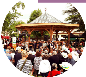
LE KIOSQUE À MUSIQUE