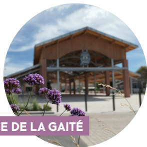
LA PLACE DE LA GAITÉ