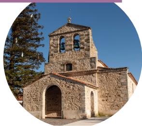
L'ÉGLISE SAINT VINCENT