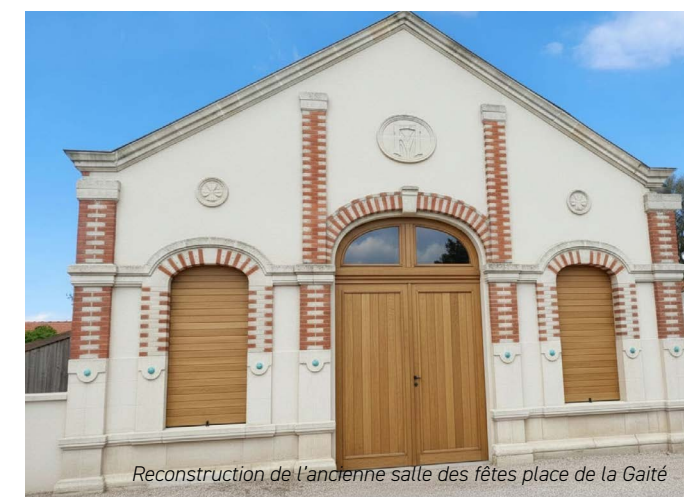
Reconstruction de l'ancienne salle des fêtes place de la Gaité