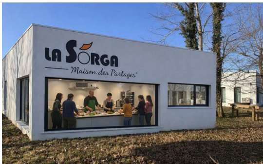
15 Extension du pôle de l'Aiguillonne