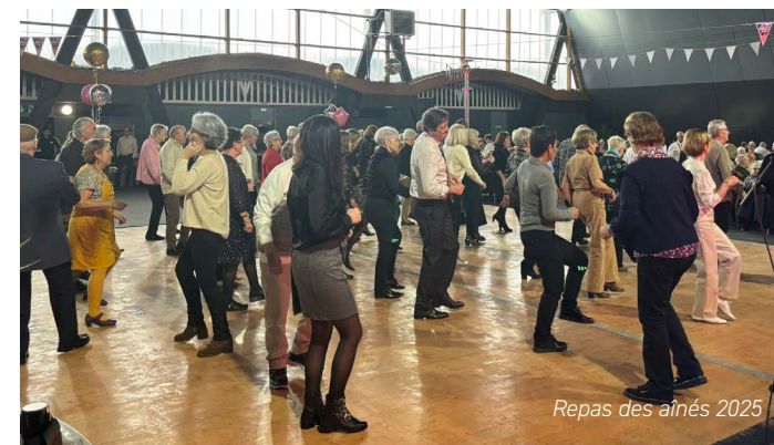
Repas des aînés 2025