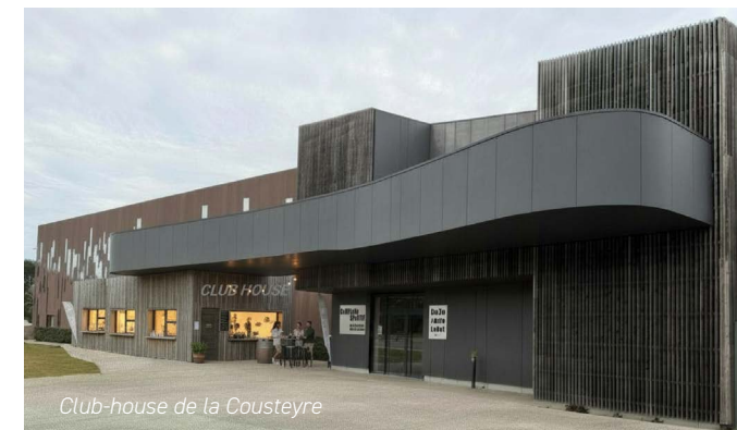
Club-house de la Cousteyre