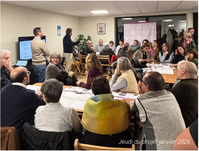
Jeudi du projet janvier 2026

Cette méthode de gouvernance par la concertation et la transparence aura vocation à se poursuivre dans les années à venir avec les nombreux dispositifs déjà mis en place (charte de la démocratie participative, permanence du Maire et des élus, concertation sur les grands projets, auto-saisie des services communaux avec l'application Thelma...) mais aussi se renforcer en utilisant par exemple, plus régulièrement les sondages citoyens (via Thelma).