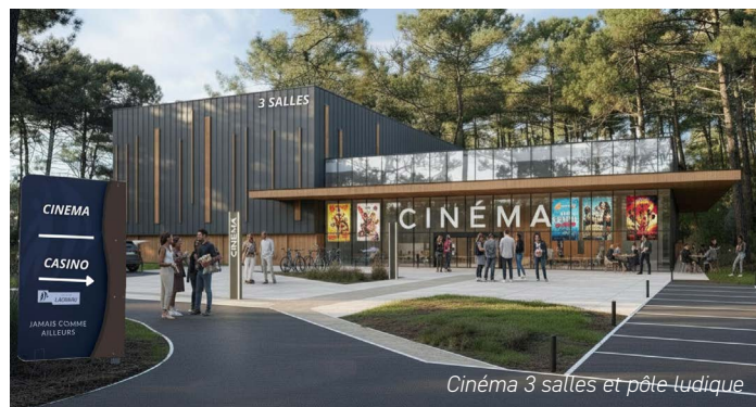
Cinéma 3 salles et pôle ludique