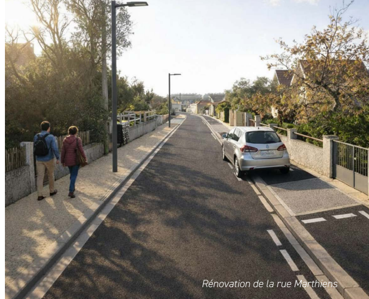
Rénovation de la rue Marthiens