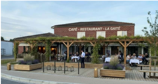
2 Réaménagement du restaurant la Gaité et de l'ancien laboratoire en commerce, reconstruction de l'ancienne salle des fêtes