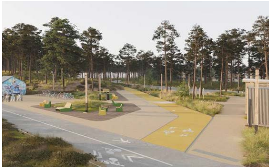
13 Pôle d'échanges multimodal