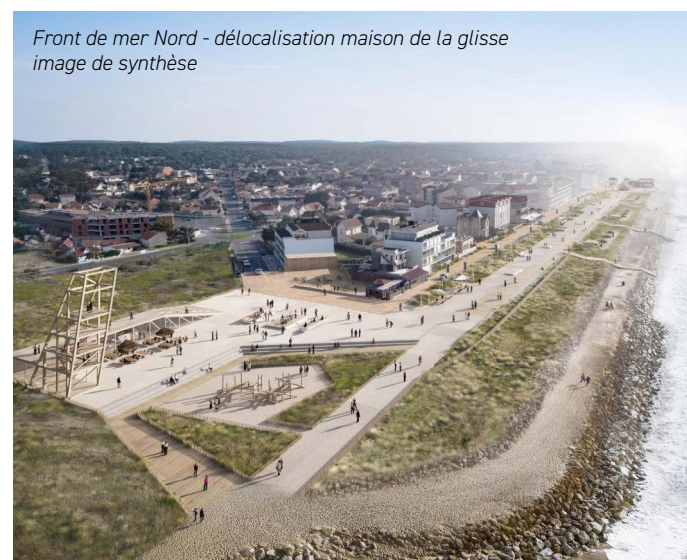
Front de mer Nord - délocalisation maison de la glisse image de synthèse

Poursuivre une action collective, anticipatrice et partenariale, fondée sur la connaissance, la gestion durable et la résilience du territoire et accompagner l'évolution du front de mer. Protéger les espaces naturels littoraux, adapter les équipements publics, tout en conciliant sécurité, usages et attractivité.