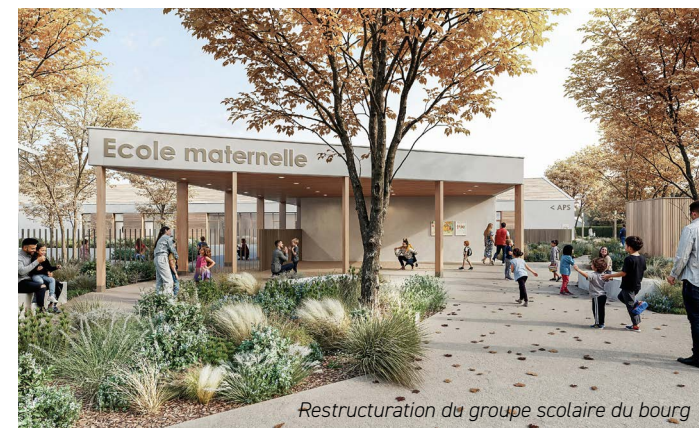
Restructuration du groupe scolaire du bourg