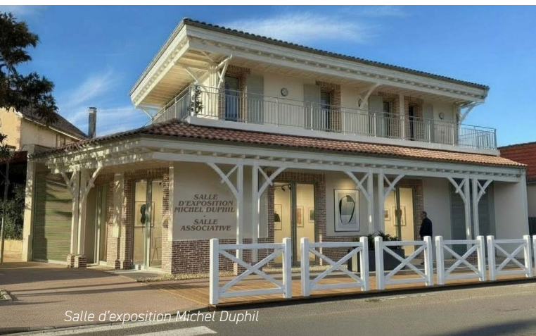
Salle d'exposition Michel Duphil