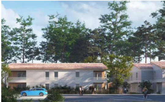
14 Livraison de logements au Huga en 2026