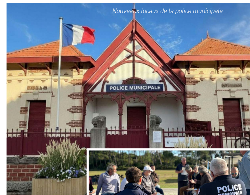
Nouveaux locaux de la police municipale