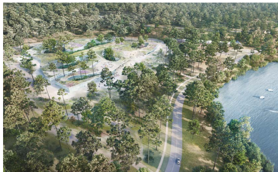
9 Projet du Pôle de Santé Territorial Ouest Médoc (PSTOM)