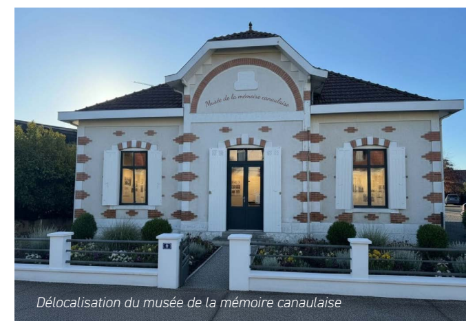
Délocalisation du musée de la mémoire canaulaise