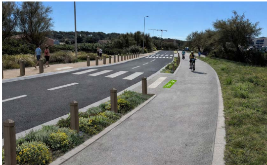
16 Voie douce rue Pasteur Océanides (Vélodyssée)