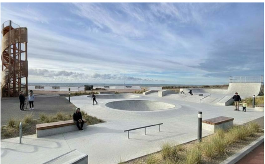
6 Création d'un nouveau Skate Park à l'océan