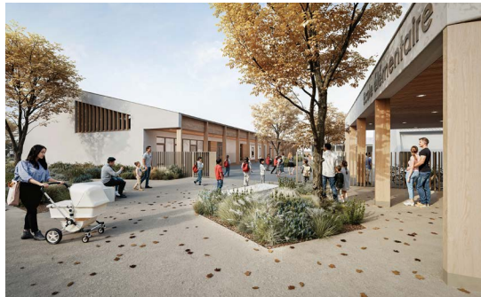
11 Restructuration du groupe scolaire de la ville