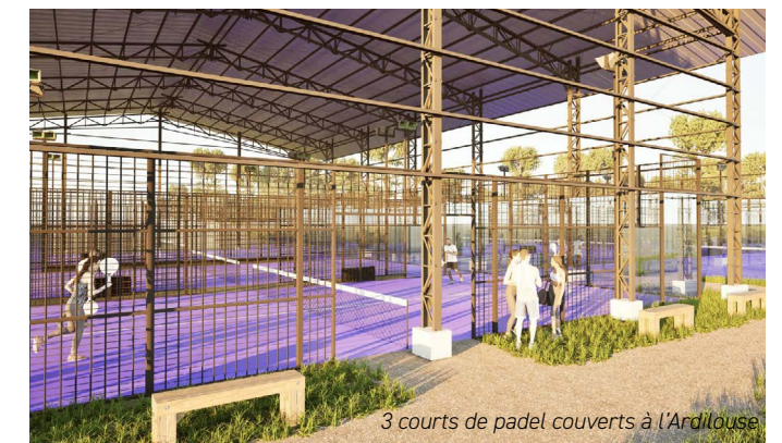
3 courts de padel couverts à l'Ardilouse