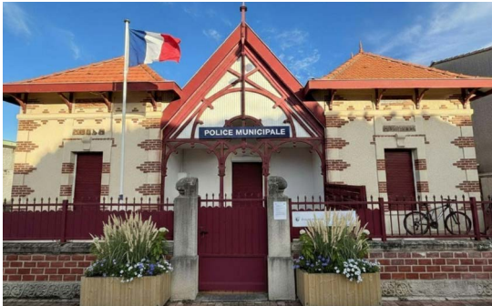
3 Création d'un nouveau poste de police municipale