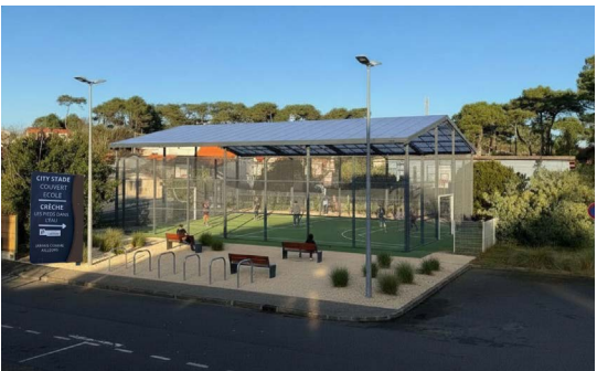
8 Création d'un city stade à proximité de l'école de l'océan