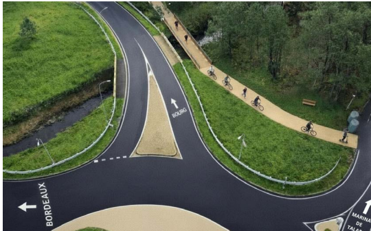
12 Création de la voie douce Talaris-collège