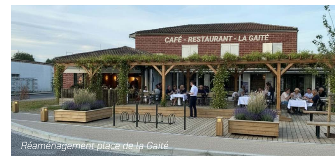
Réaménagement place de la Gaité

Soutenir une économie locale dynamique, innovante et durable, accompagner le développement économique en lien avec nos identités (glisse, sport, écologie, artisanat) tout en renforçant le dialogue avec les commerçants et en favorisant un tourisme responsable et créateur de valeur toute l'année.