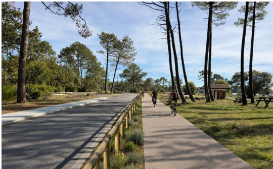
5 Création d'une liaison douce Halte Nautique (Pech Lèbre) - Marina de Talaris