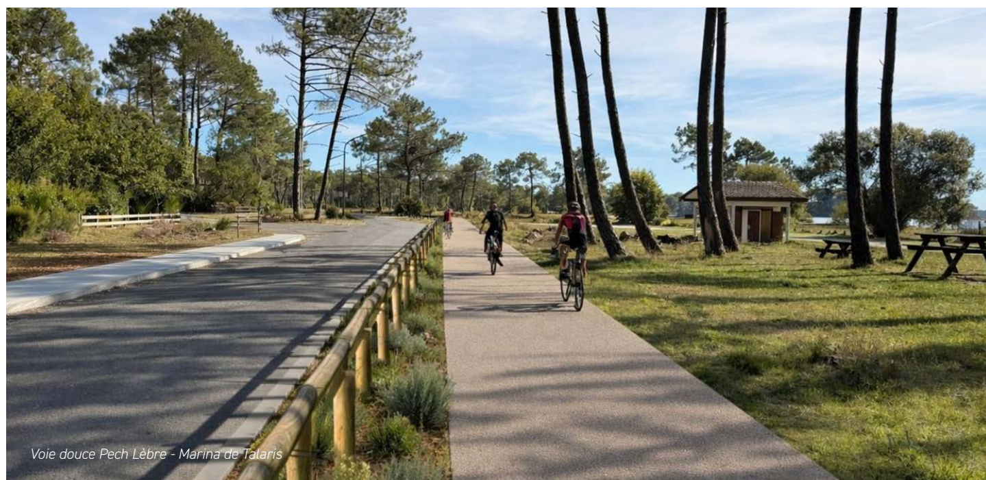
Voie douce Pech Lèbre - Marina de Talaris