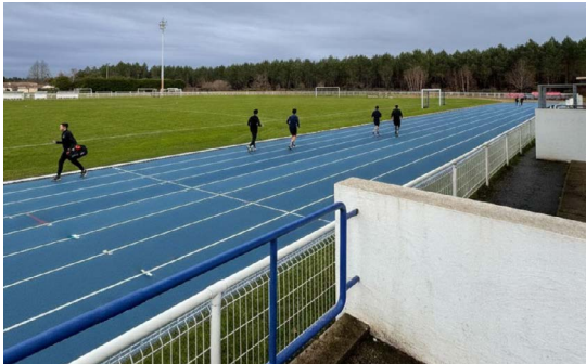
1 Nouvelle Piste d'Atlétisme au stade A. François