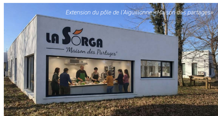
Extension du pôle de l'Aiguillonne «Maison des partages»