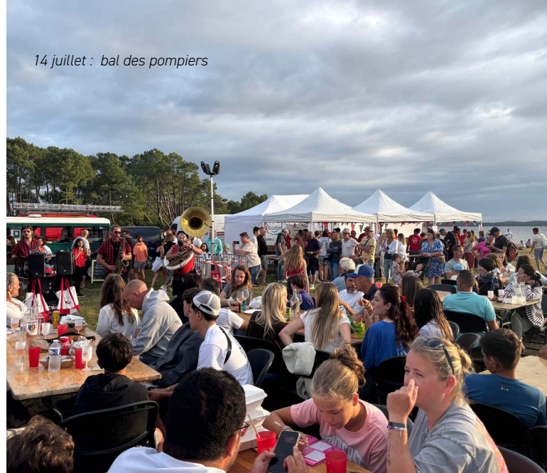
14 juillet : bal des pompiers